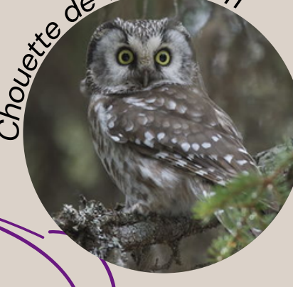
Chouette de Tengmalm